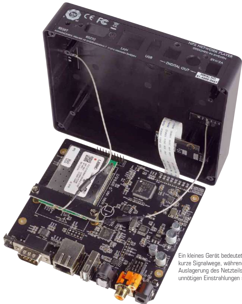
Ein kleines Gerät bedeutet auch kurze Signalwege, während die Auslagerung des Netzteils vor unnötigen Einstrahlungen schützt

schließlich bei der Nutzung von USB. Bei den PCM-Samplingraten sind dann wieder alle Anschlüsse identisch und ermöglichen die Verwendung von maximal 192 kHz bei 24 Bit. Verstärker mit digitalen Anschlüssen bekommen