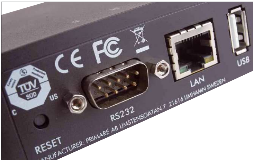
Mithilfe des RS232-Anschlusses können Steuersignale an verbundene Primare-Geräte weitergeleitet werden

hier also das Maximum geboten, das mit den beiden Übertragungsvarianten möglich ist. Sollte das angeschlossene Gerät damit jedoch überfordert sein, weil es eventuell schon ein wenig älter ist, lässt sich das Ausgabesignal auch auf 48 oder 96 kHz begrenzen. Wer weitere Geräte von Primare nutzt, kann außerdem den RS232-Anschluss nutzen, um beispielsweise die Lautstärke des Verstärkers mit der App des Streamers zu steuern.