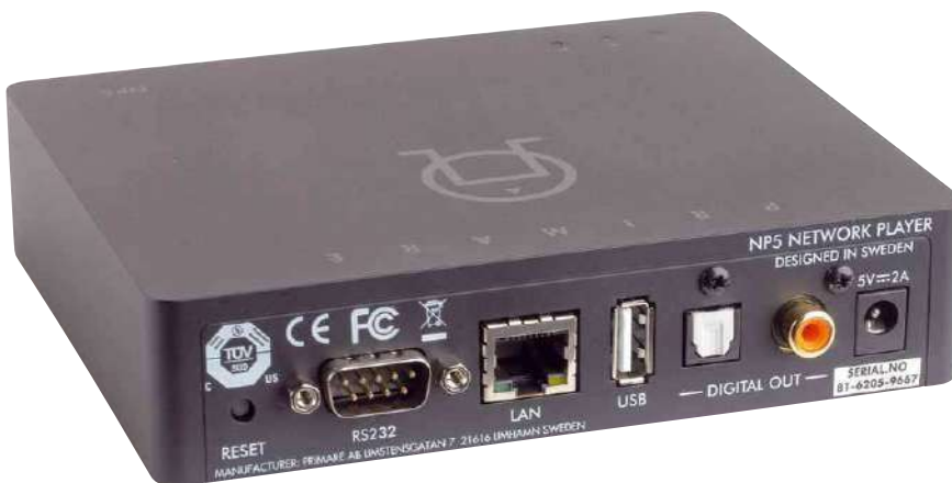
Auf einen USB-Ausgang verzichtet man beim NP5 doch auch mit den beiden S/PDIF-Varianten ist der kleine Streamer schon gut aufgestellt

gering zu halten. Der Bildschirm wird in drei Segmente aufgeteilt, die das Wahren der Übersicht besonders erleichtern. Am unteren Bildschirmrand findet man das momentan laufende Lied und alle Wiedergabefunktionen. Links gibt es Zugriff auf alle verbundenen Quellen und rechts bleibt viel Raum zur Navigation durch die ausgesuchten Musikspeicher, wobei sogar die Größe der Cover oder Ordner in vier Stufen angepasst werden kann. Eine Wort- und eine Buchstabensuche erleichtern zusätzlich das Finden des gewünschten Albums.